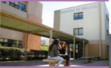
INSTITUTO DE TEOLOGÍA

Instituto de Teología Universidad Católica de la Santísima Concepción